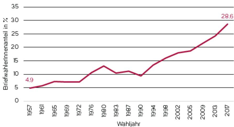
Abbildung 1: BriefwählerInnenanteil bei Bundestagswahlen